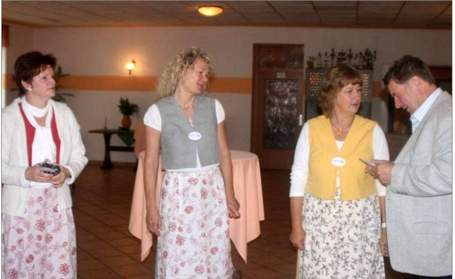
Festveranstaltung zum 10-jährigen Bestehen unseres Vereins am 18. September 2011