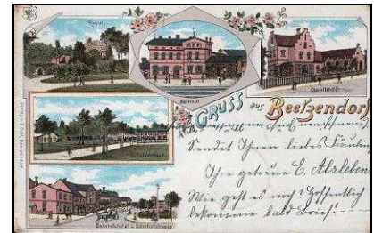
Historische Ansichtskarten mit Grüßen aus Beetendorf